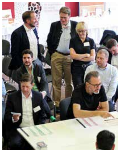
Der Themenpark »Die Expertenjury« von Ole Bolling und Tobias Kredel (beide Pacproject) stellte die Teilnehmer vor viel- fältige Aufgaben.