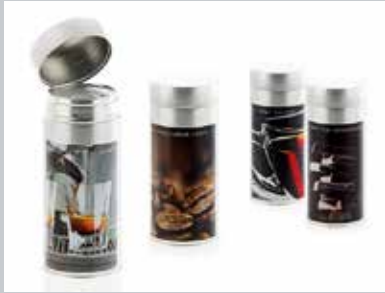
Aromaschutz groß geschrieben: luftdichte Kaffeedose.