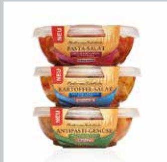
Moderne Convenience-Produkte mit mediterraner Stimmung.