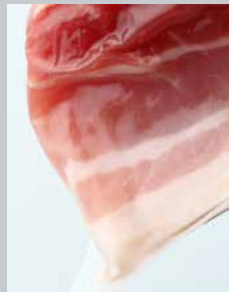
Oft nicht sichtbar: Reißfestigkeit von Lebensmittelfolien.