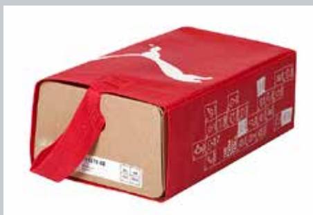
Pfiffiges Packungskonzept spart Material