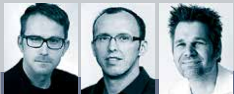
S + T Creativ paart Kreativität mit technischer Umsetzbarkeit.

In dieser Ausgabe zum Thema Convenience hat Schoch & Sonders , Zürich/Schweiz, eine besondere Verpackung der August Faller AG , Waldkirch, in Szene gesetzt. Es handelt sich um eine Faltschachtelkonstruktion sowie ein Multipage-Etikett (weitere Details auf Seite 31 dieser Ausgabe). Mit diesem Sujet wird aufgezeigt, dass auch im Bereich der Medizinalprodukte immer wieder aufs Neue das Unmögliche möglich gemacht wird.