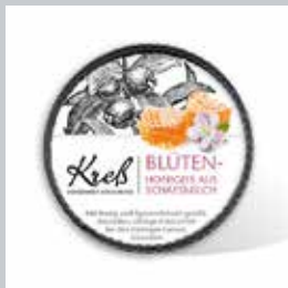
Erfolg durch starken Verpackungsauftritt