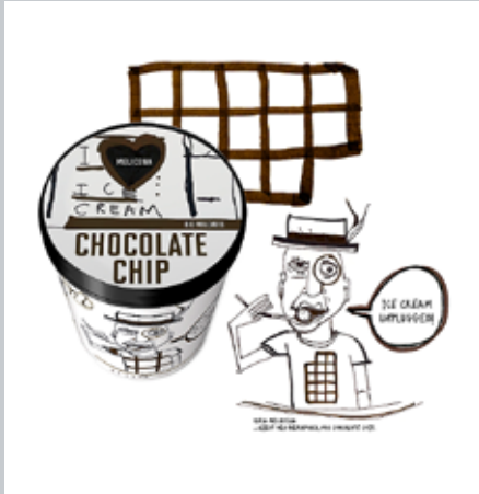
Eis spielt mit Charakteren.