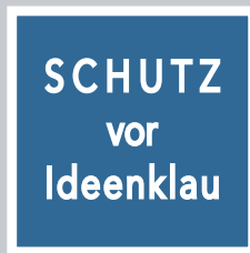
Absicherung bei einem Pitch.