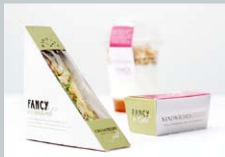
Neue Fresh-Food-Kette mit englischem Charme.