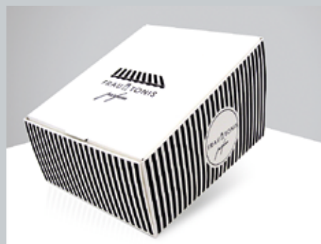
Was sich wohl hinter dieser schicken Faltschachtel verbirgt?