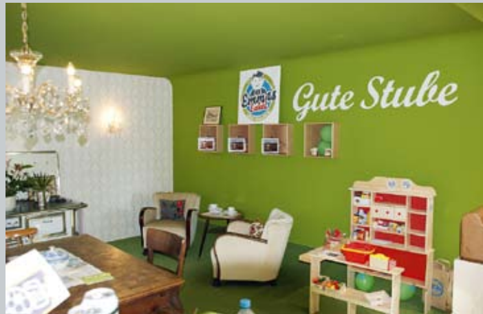
»Emmas Enkel« verbindet Nostalgie mit Moderne.